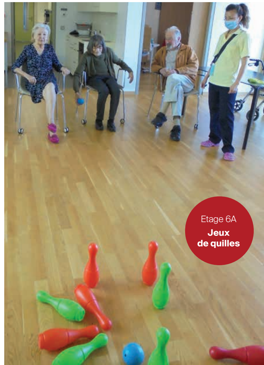
Etage 6A Jeux de quilles