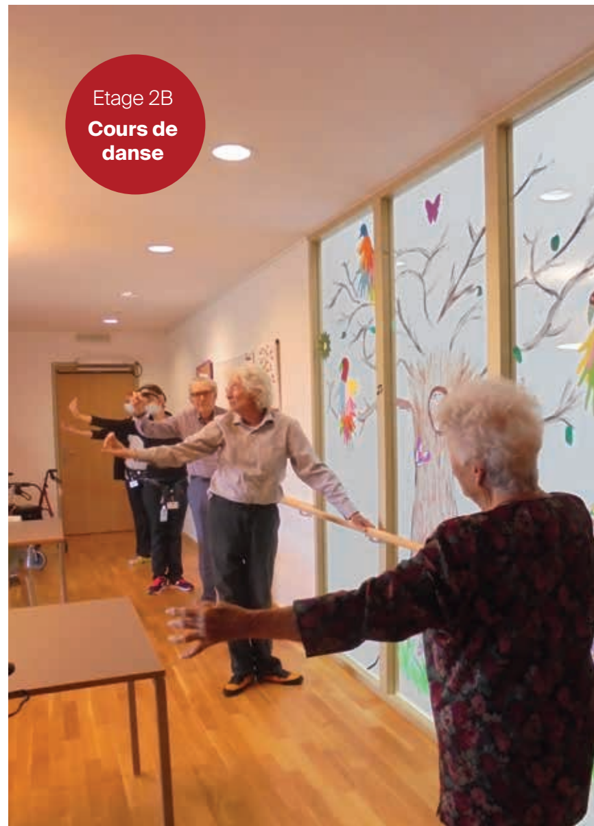
Etage 2B Cours de danse