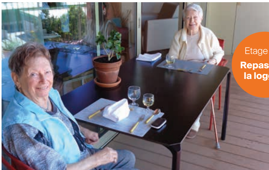
Etage 5A Repas sur la loggia