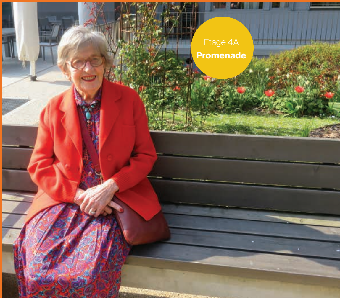
Etage 4A Promenade