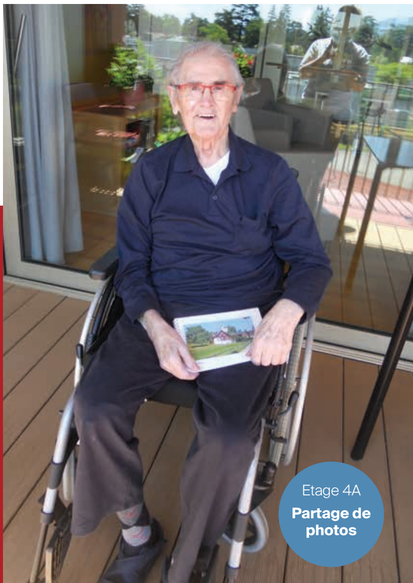
Etage 4A Partage de photos