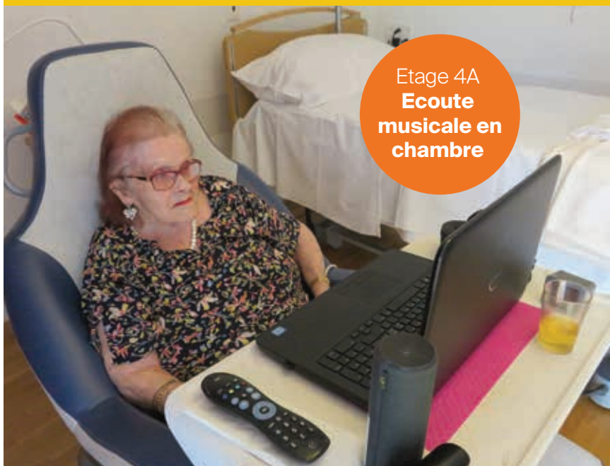
Etage 4A Ecoute musicale en chambre