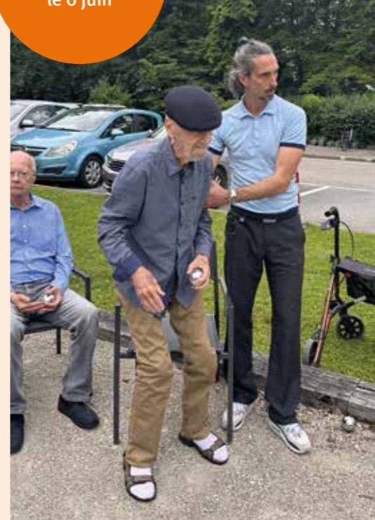
Soirée barbecue-pétanque le 6 juin