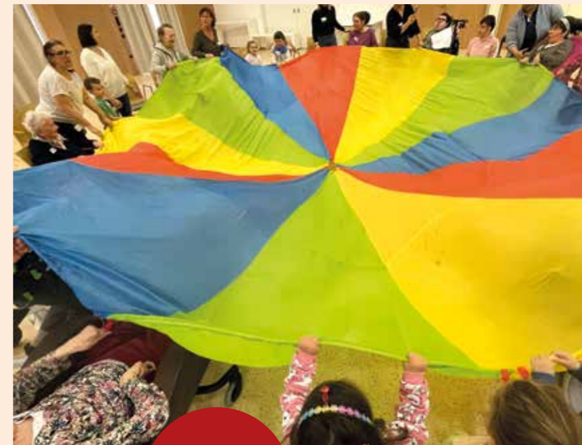
Boum intergénérationnel le 24 avril