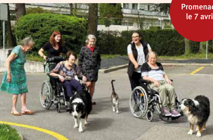
Promenade le 7 avril