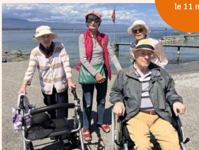
A la plage des Eaux-Vives le 11 mai