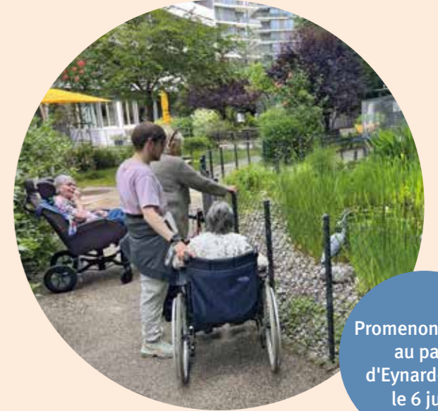
Promenons-nous au parc d'Eynard-Fatio le 6 juin