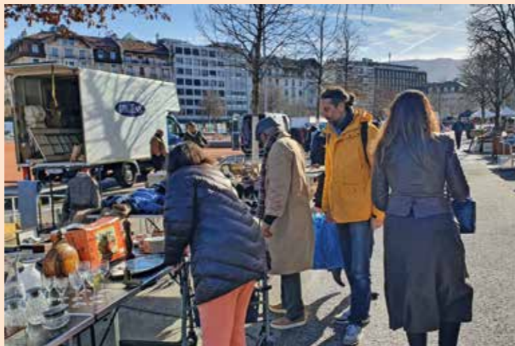
Sortie au marché aux puces de Plainpalais le 29 janvier